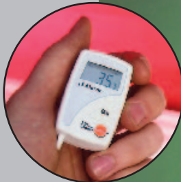
testo 174 Temperatur-Mini-Datenlogger