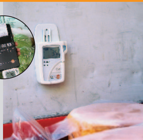
Temperaturschwankungen in Lagerräumen registrieren