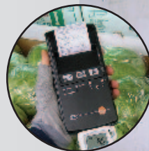
Daten-Dokumentation vor Ort mit Schnelldrucker testo 575 (optional)