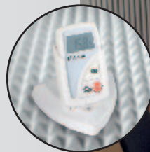
Datenübertragung zum PC oder Notebook via Interface (Option)