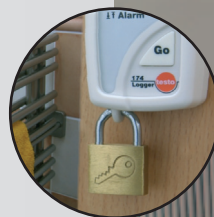
Diebstahlsichere Installation am Messort