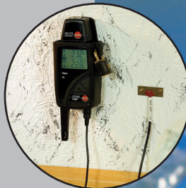
testo 177 Profi-Datenlogger für Temperatur und Feuchte