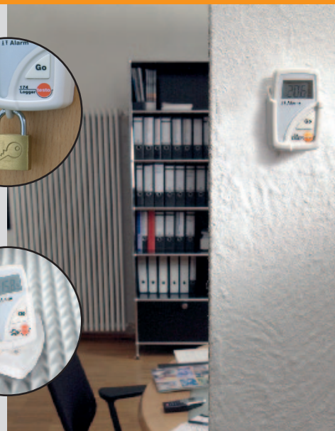
Raumtemperatur-Aufzeichnung mit sofortiger Alarmanzeige bei Grenzüber- und Unterschreitungen