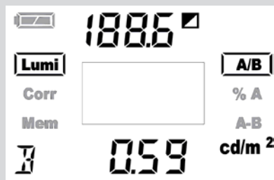
Displayanzeige einer Verhältnismessung A/B