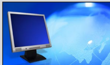
Reflexionsmessung am Monitor