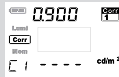
Displayanzeige mit Korrektur Eingabe