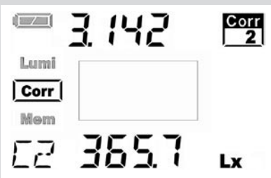
Displayanzeige der Luxmessung mit Reflexionsstandard