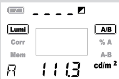
Displayanzeige einer Leuchtdichtemessung

Das Gerät besitzt einen Messwertspeicher mit bis zu 1000 Speicherplätzen der in 10 Gruppen einteilbar ist. Dieser kann sowohl direkt über Tastatur und Display als auch über die eingebaute USB-Schnittstelle und der im Lieferumfang enthaltenen Standard-Software im PC ausgelesen und weiterverarbeitet werden.