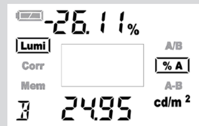
Displayanzeige einer Verhältnismessung % A