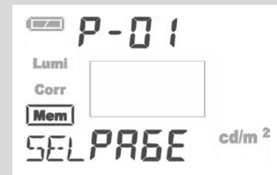
Displayanzeige der Speicheranzeige